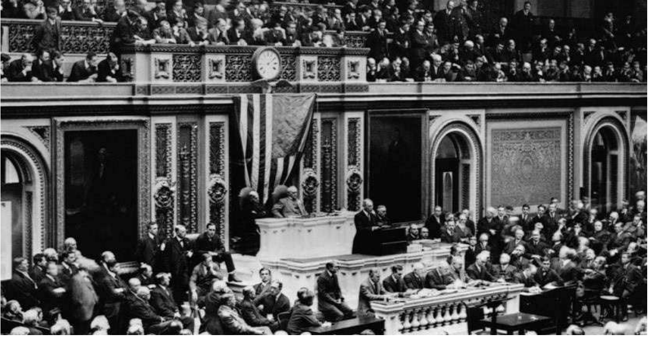
Woodrow Wilson Amerikan Kongresinde Savaş Kararını Açıklarken