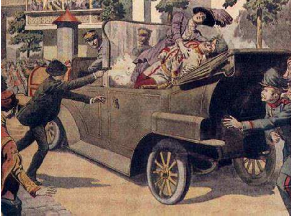
Arşidük Franz Ferdinand'ın Saray Bosna'da öldürülmesi

Aslına bakarsanız bu suikastin saçmalığı da bu olayı özetler niteliktedir. Bir Sırp olan Gavrilo Princip, öncelikle Franz Ferdinand'ın arabasına el bombası atmış fakat bomba arkada patlamıştı. Bu olay sadece şoförün yaralanmasına sebep olmuştu. Valinin konutuna gelen Ferdinand, "Yani ziyaretçilerinizi böyle, bombalarla mı karşılıyorsunuz?" şeklinde bağırıyordu. Konutta idarecileri cezalandırdıktan sonra eşiyile birlikte yaralı şoförünü ziyaret etmek için hastaneye gitmek istedi. Arşidükün yeni şoförü hastaneye giderken yanlış bir yola saptı ve girdiği sokaktan çıkarken, daha önce suikaste yeltenen kişinin yani Princip'in tam önünde durdu. Katil ise, doğal olarak, ikinci fırsatı kaçırmadı.