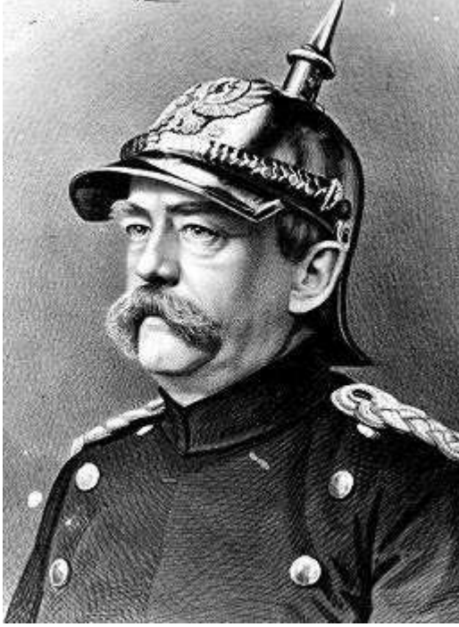
Alman Şansölye Otto Von Bismarck

Metternich'in 1815 Viyana kongresiyle birlikte oluşturduğu Avrupa uyumu düzeni, Almanya'yı bölünmüş bir şekilde bırakmıştı. Metternich, Alman idealini gerçekleştirebilirdi fakat bu zeki diplomat – ironik bir şekilde - milliyetçi akımlara karşı en büyük düşmanlardan birisiydi. Bunun üzerine bu ideali Prusya üstlenecek ve Otto von Bismarck yürütecektir.