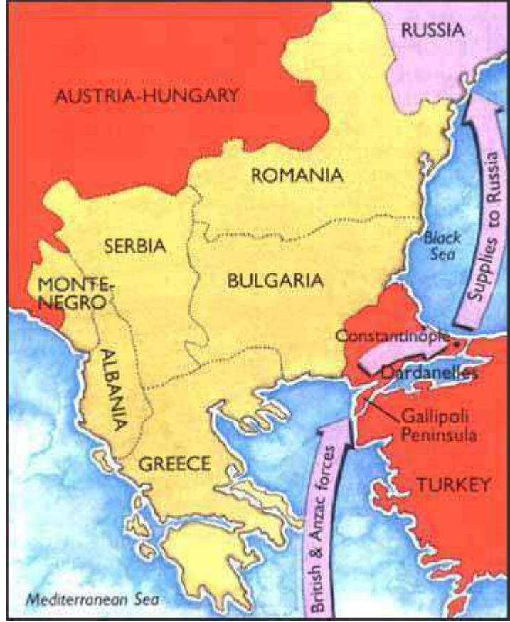
İttifak Devletleri'nin Çanakkale Savaşı ile Rusya'ya yardım planı

Rusya, seferberliğini hızlıca tamamladıktan sonra Almanya'nın üzerine yürüdü. Fakat Almanlar Tannenberg Muharebesi'nde büyük bir zafer kazandılar. Böylece Rusya, saldırı gücünü kaybetmiş oldu ve savunmaya geçmek zorunda kaldı. İşte bu güçten mahrum kalan Rusya'ya İngiltere ve Fransa yardım etmek isteyecek ve 1915 yılında bu yardım için Çanakkale Boğazı'nı kullanacaklardır. Britanya Donanma Bakanı Winston Churchill'e göre bu saldırıyla birlikte Üçlü İttifak'ın "yumuşak karnına" darbe vurulacaktı. Fakat zamanının en üst düzey askeri teknolojileriyle donanmış ve sömürgelerindeki askeri güçleri de kendi savaş gücüne katmış